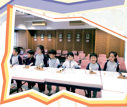
組員靜待導師的指揮，準備要拿起手鈴板演奏了。