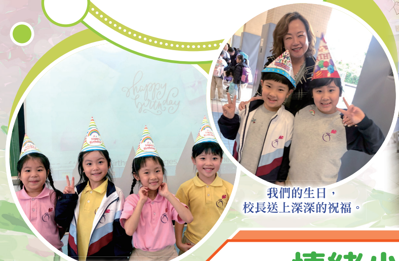
我們都是可愛的壽星女，來！笑一個！

對很多小朋友而言，生日是他們最快樂的日子。班主任會為他們舉辦生日會，和同學一起慶祝生日。訓輔組為各班準備莎莉蛋糕，有些同學也會準備零食，甚至帶着親手製作的小食回校和同學分享，令生日會更快樂！除了生日會外，訓輔組還會為低年級的同學準備生日帽，高年級的同學則有生日襟章。老師和同學看見壽星仔、壽星女時，也會跟他們說聲：「生日快樂！」讓生日的同學能得到一眾老師和同學的祝福。