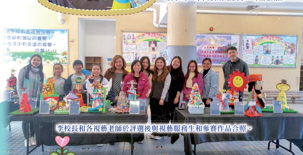
李校長和各視藝老師於評選後與視藝服務生和參賽作品合照。