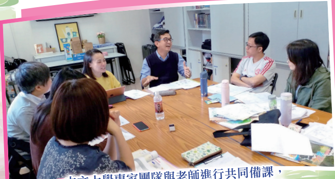
中文大學專家團隊與老師進行共同備課，以協助不同能力的學生獲得更好的學習體驗。