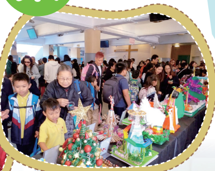
放學時，家長們踴躍投票，氣氛熱烈。