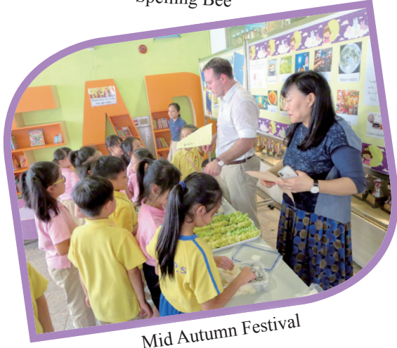
Mid Autumn Festival