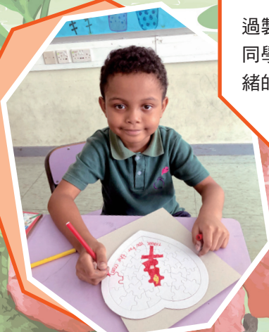
在天父的花園裡，你我同是寶貝。

至於低年級同學，會在全方位時段進行情緒小手工。透過製作雋語相架、鬼口水、感恩拼圖和彩珠水瓶等活動，讓同學能認識、了解和接納自己的情緒，以及學習一些舒緩情緒的方法，應付生活中可能面對的各種壓力。