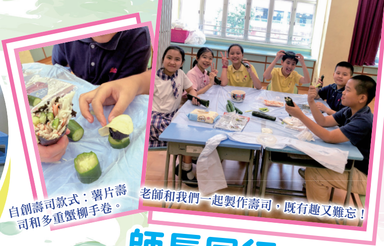
自創壽司款式：薯片壽司和多重蟹柳手卷。