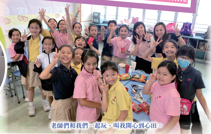
老師們和我們一起玩，叫我開心到心田。

每年，我們也會在高年級進行「師長同行」計劃。顧名思義，就是老師和固定的一小撮學生，在成長路上，結伴同行。本年度，訓輔組透過學生和老師彼此的共同興趣來分組，讓老師和學生一起在校園中做自己喜歡的事，例如看書、做運動、聽音樂。透過興趣交流，讓彼此的話題增加，並帶來更多歡樂。另外，老師也會選擇一些空閒時間，約見他們，和他們吃吃飯，談談天，彼此關心。