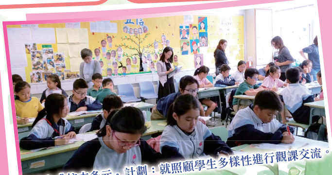
賽馬會『校本多元』計劃：就照顧學生多樣性進行觀課交流。

本年度，本校有幸能參與賽馬會『校本多元』計劃，與來自中文大學的專家團隊合助，繼續以適異教學法的概念去持續優化中文科及常識科的學與教，並發展中常跨科活動。期望能透過老師團隊中的專業交流，推動本校其他科目持續優化學與教，照顧學生多樣性。