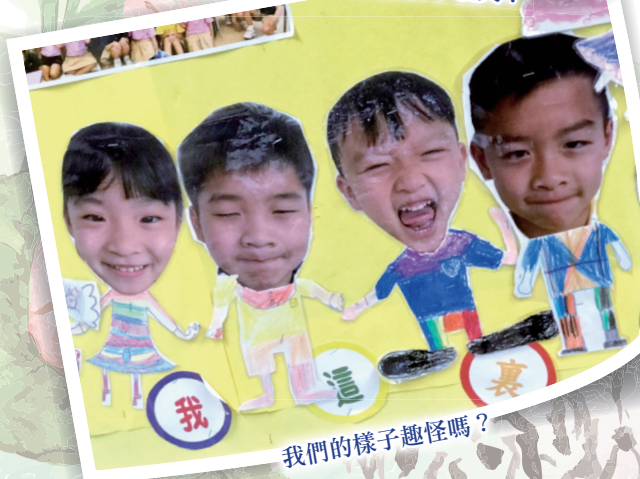
我們的樣子趣怪嗎？