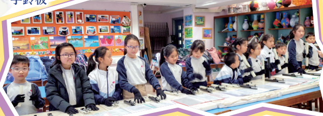
手鐘隊組員平時練習情形

本校手鐘隊的成員是由三至六年級的同學組成，而本年度新開辦的手鈴板隊，對象則是一、二年級的同學。這兩個隊伍均由外聘專業導師教導，學生透過學習手鐘和手鈴板演奏的技巧、歌曲演練及代表學校參加比賽去提昇個人自信、專注力及耐性。從團隊練習過程中，更能夠促進學生的協調技能及社交能力，學習團隊精神。手鐘隊於去年參加第十四屆校際手鈴比賽，並且獲得銀獎。