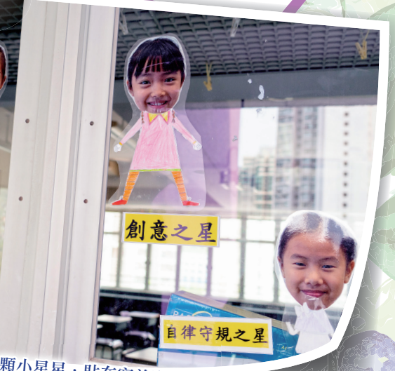
一顆一顆小星星，貼在窗前發光明。

為了讓同學肯定自己的優點，嘗試欣賞自己所擁有的才華和恩賜，學習不與人比較，訓輔組在各班舉行了「班中之星選舉」。這項選舉不單是由老師觀察評選，更透過同學推薦、自薦，經過全班投票而選出。可見，獲獎者得到老師和各同學的肯定，在領獎時更能感受到被接納和認同，有助學生建立自信心和成功感。「班中之星選舉」的獎項很多元化，共有 30 多項，例如：善良、誠實、勇敢、孝順父母、樂於助人、身手不凡等。每個月，班主任也會進行一次「班中之星選舉」，務求讓每個學生都得到被肯定和接納的機會。