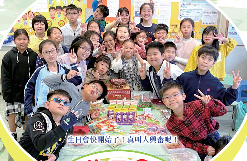
生日會快開始了！真叫人興奮呢！