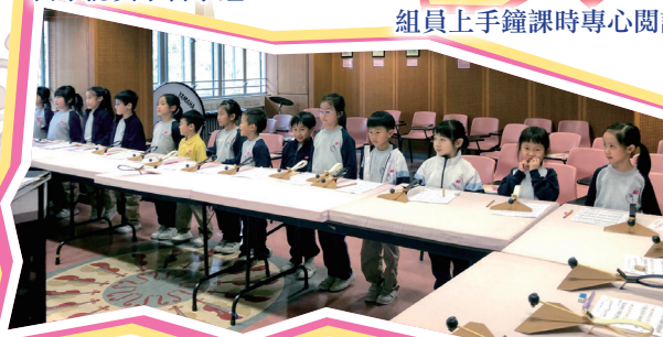
我們精神抖擻，發揮團體精神，一起合奏手鈴板。