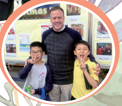
For our students, celebrating Christmas was fun and receiving candy cane sticks was a special treat for them.