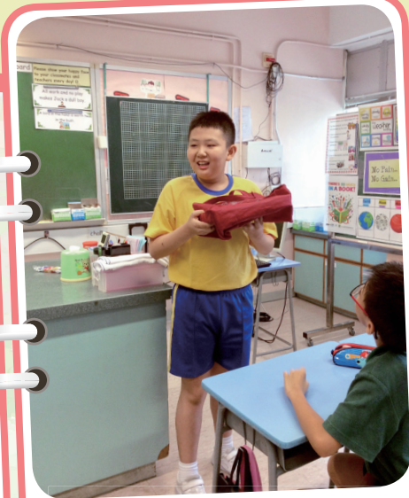
英 2 組的同學正進行 'Show and Tell' 說話活動。