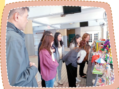
由於參賽作品質素很高，評選作品時，令評判傷透腦筋。