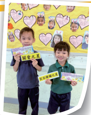
得到老師和同學的肯定，很開心啊！