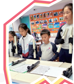
組員上手鐘課時專心閱譜。