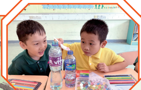
看見這些彩珠已叫我興奮不已，要小心翼翼把它們放進瓶子裡。