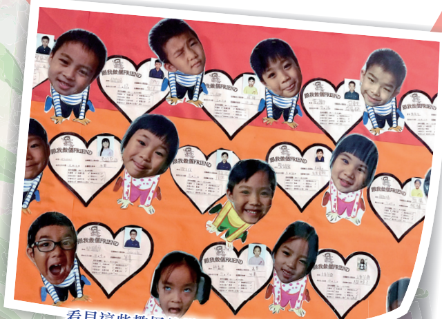
看見這些趣怪的樣子，叫我如何不發笑？

訓輔組在學年初為全校每一位同學拍攝趣怪相片，並把他們的相片張貼在課室壁報板上，學生於小息時看見同學和自己趣怪的樣子，不禁捧腹大笑，為班中增添了不少歡樂氣氛。而且，多看一些歡樂的笑臉，心情自然也會歡樂一點。