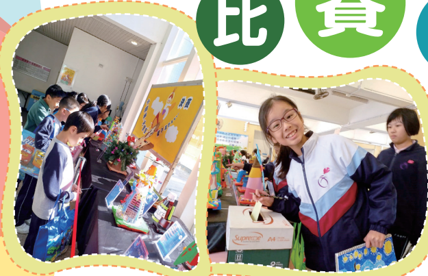
同學們在視藝課進行投票活動。