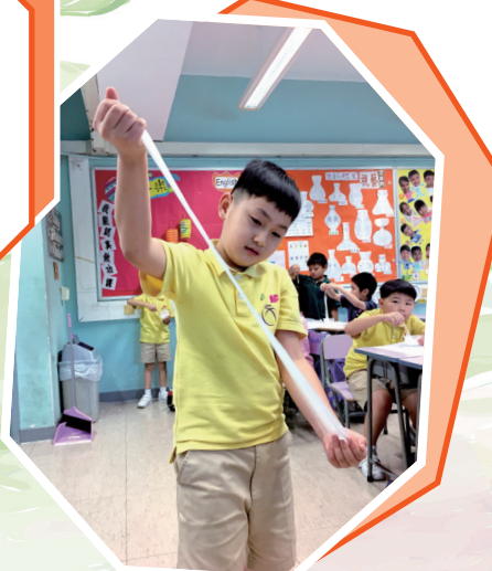
我拉我拉我拉拉拉……看，我的鬼口水多長啊！