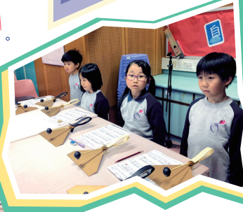
手鈴板比我的臉還大呢！但我能演奏它。